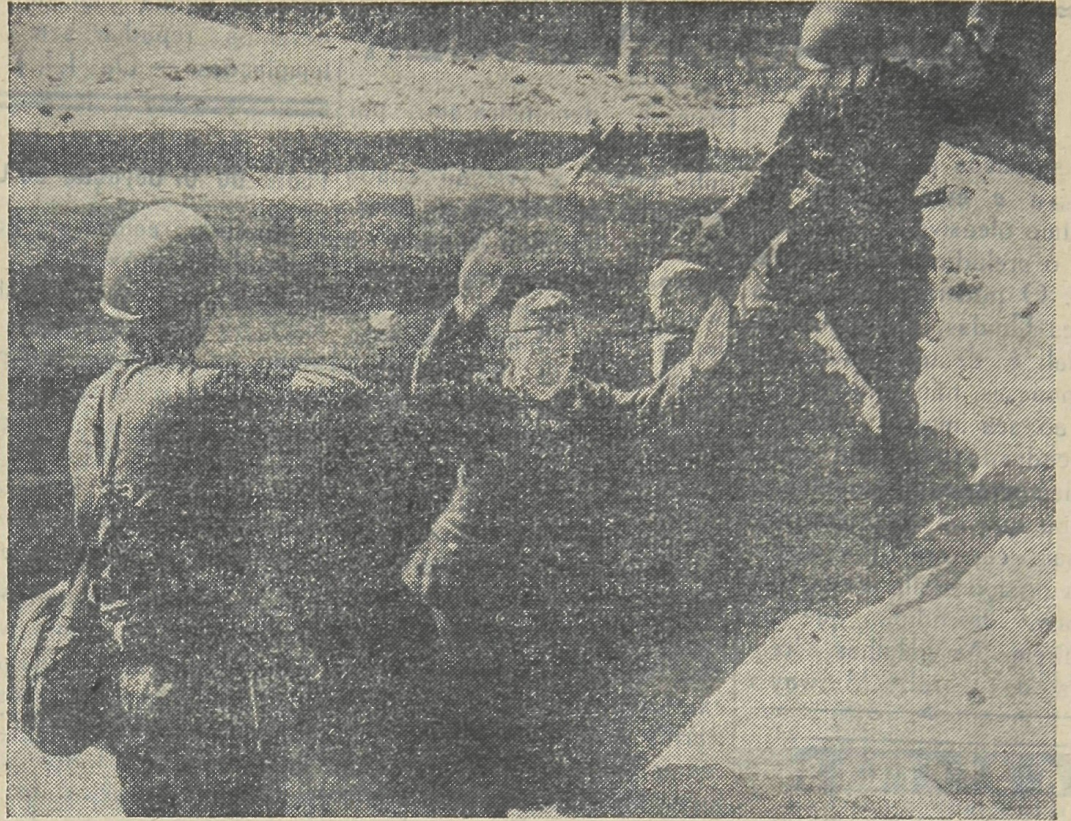
A fotografia acima mostra um expressivo flagrante da prisão de um soldado alemão na frente oriental. O jovem nazista, quasi um menino, se entrega prisioneiro aos soldados russos que, bem armados para evitar surpresas, o esperam á entrada da fortificação.

Um exemplo típico do que acima afirmamos é a área em torno de Cuiabá, no Estado de Mato Grosso. Os viajantes que regressam daquela região revelam que os seringueiros estão ganhando aproximadamente 30 cruzeiros diários. Trata-se, em sua maioria, de homens que nunca se preocuparam com a extração da borracha, e que somente há poucos meses descobriram que poderiam ganhar com borracha dinheiro suficiente para viver confortavelmente. A exploração da borracha é muito fácil e os interessados poderão