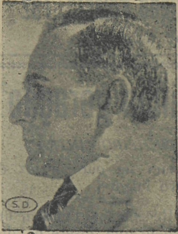
S. Excia. Dr. Getúlio Vargas

O aniversário do Presidente Getúlio Vargas é dia de festa para a indústria brasileira que tanto deve à ação esclarecida do governante que se propoz alisar a passagem da nossa economia da fase agrária para a fase industrial. As estatísticas referentes à produção brasileira nos últimos dez anos mostram quão fecunda tem sido a orientação da política econômica do presidente Getúlio Vargas para lograr esse objetivo. Não há um único setor industrial que não acuse um crescimento excepcional neste período, muitos deles em franca paralisação quando o sr. Getúlio Vargas chegou à Presidência da República. Além disso, coube ao Chefe da Nação encaminhar as acertadas soluções que permitiram a estruturação das nossas indústrias de base, sobre as quais ha de repousar o imenso aparelhamento industrial que estamos construindo rapidamente. Volta Redonda, aí está como um monumento ao descorlinio e à